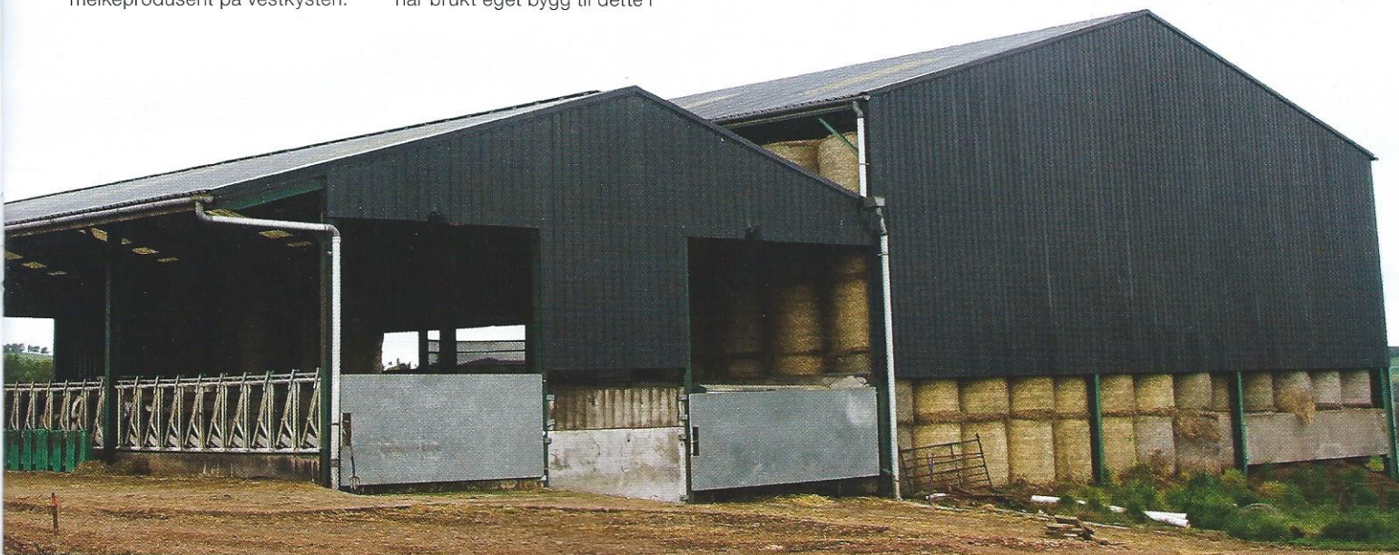
Det er bygges enkle og rimelige hus for ammekyr i Skottland. Da Buskap var på besøk skulle Rulesmain i gang med nytt oksefjøs for ca. 160 okser. Budsjettet var litt over millionen.