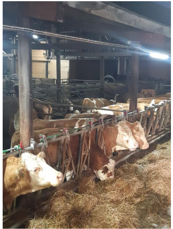
Simmentalbesetningen til Bjarte Nes.