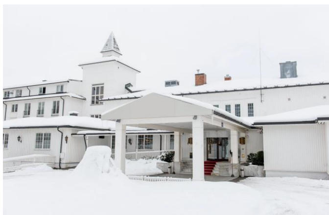
Scandic Hotell Lillehammer.

Om nødvendig felles transport til besetningsbesøk i Gausdal.